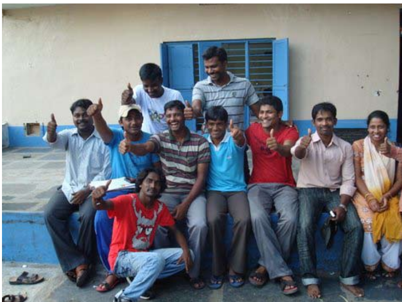
Fruits of Navajeevan: De volwassen 'straatkinderen' blijven betrokken bij Navajeevan, hun familie .....