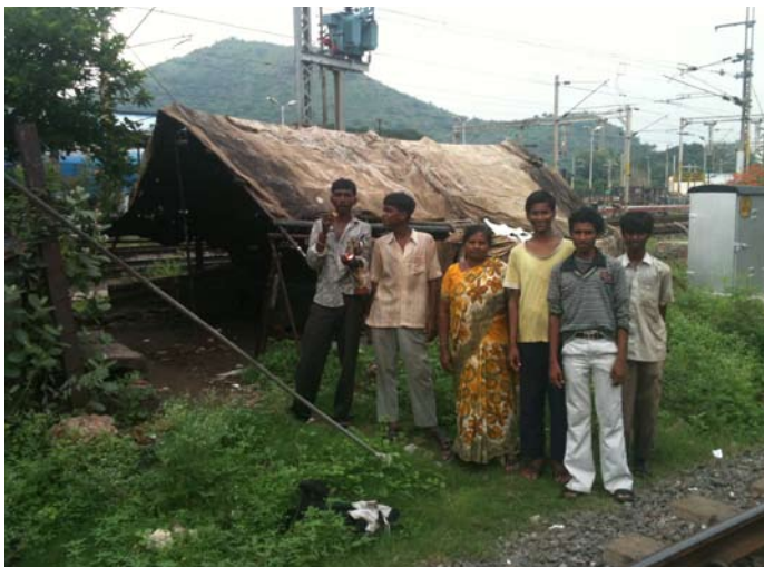
Oudere straatjongeren worden bezocht door een straatwerker bij hun 'huis' op het station.