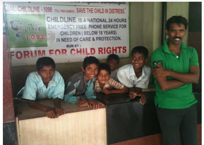
5 kinderen in afwachting om door Abis naar huis gebracht te worden.

Het begint eigenlijk op het moment dat een kind wordt opgemerkt door het street presence team, dat vooral actief is op het station van Vijayawada. Wij zijn tijdens ons bezoek met een aantal straatwerkers op pad geweest naar het station van Vijayawada. Deze mensen zijn elke dag aanwezig op het station en op een aantal andere plekken in de stad waar straatkinderen zich vaak ophouden. Zij onderhouden contact met een groepje oudere jongens die hun zelfstandige straatleven niet op willen geven. Maar het belangrijkste onderdeel van hun werk is toch wel het "opvangen" van jonge kinderen die vers op het station zijn aangekomen, na van huis te zijn weggelopen. Zodra ze zo'n kind opmerken wordt er contact gelegd en wordt het kind overgehaald om mee te komen naar de shelter waar het kind wordt