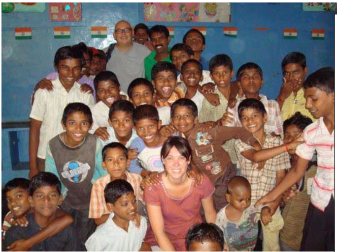
Op bezoek in de shelter