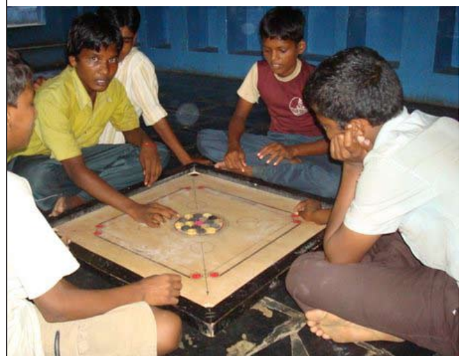
Carrom is bijzonder populair in de shelter