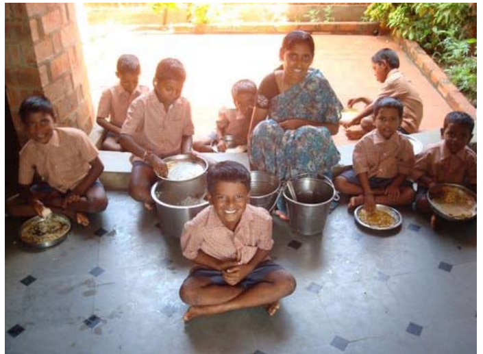
Lunch in Chiguru